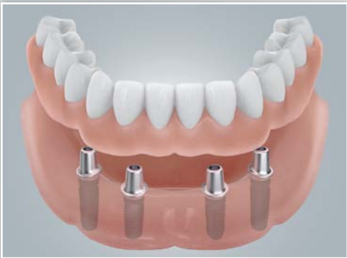
Befestigung mit Doppelkronen