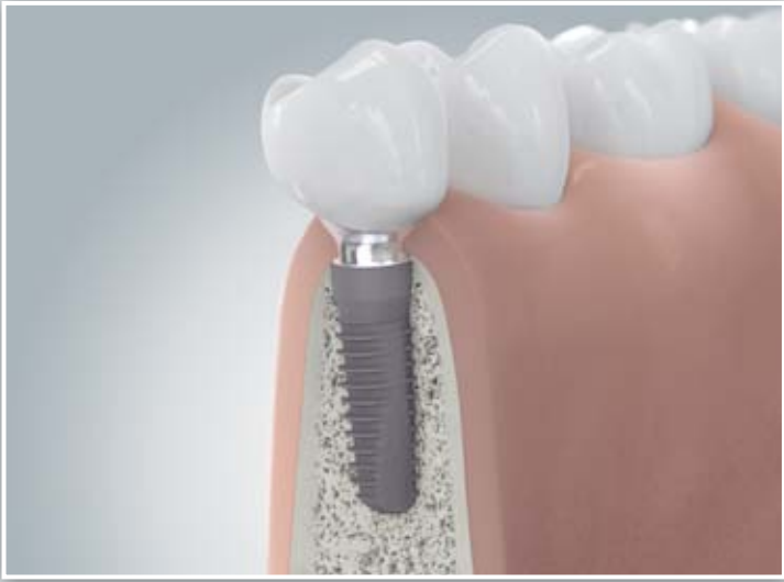
Implantatkrone nach Knochenaufbau