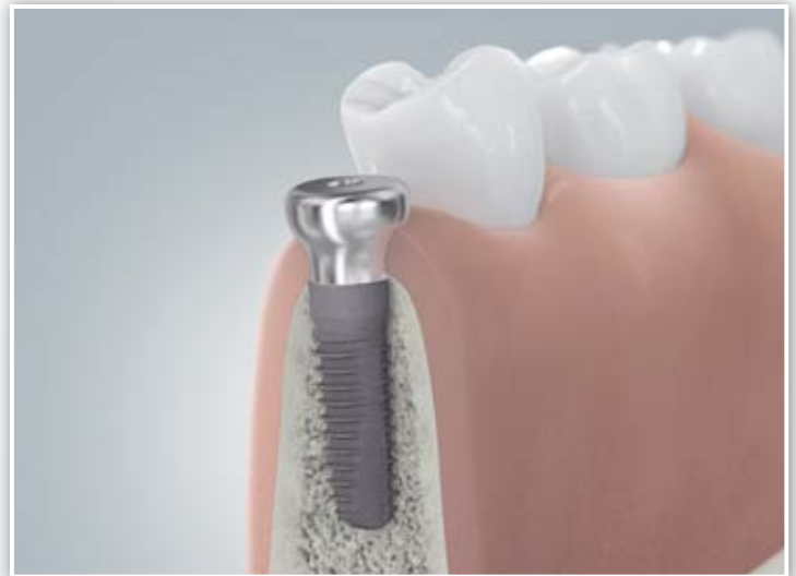
Ausformen des Zahnfleisches