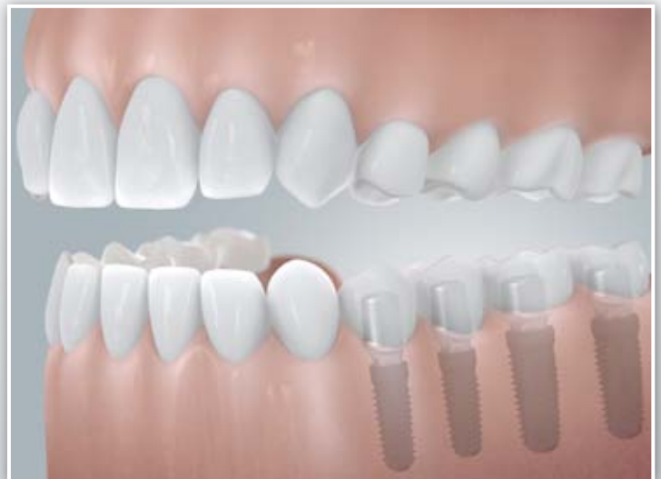
Einzelkronen auf mehreren Implantaten