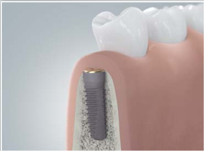
Einheilen des eingesetzten Implantats