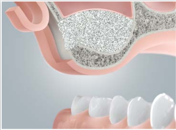
Knochenaufbau im Oberkiefer (Sinusbodenelevation)