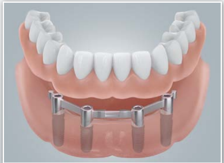
Befestigung mit einem Steg