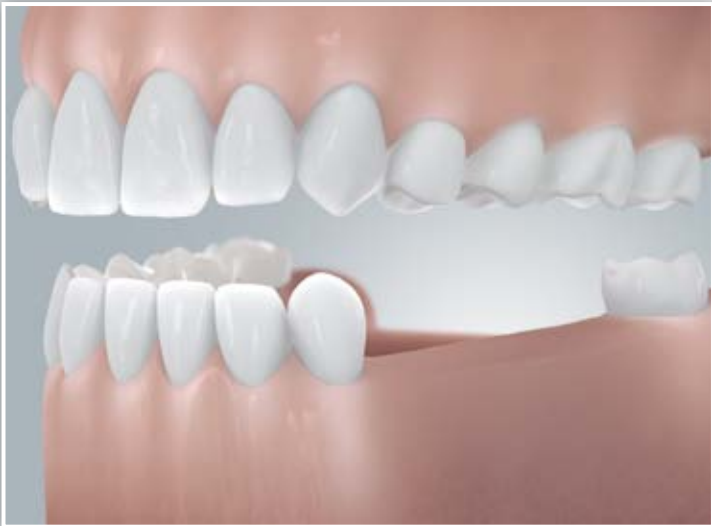
Schaltlücke (zahnbegrenzte Lücke)