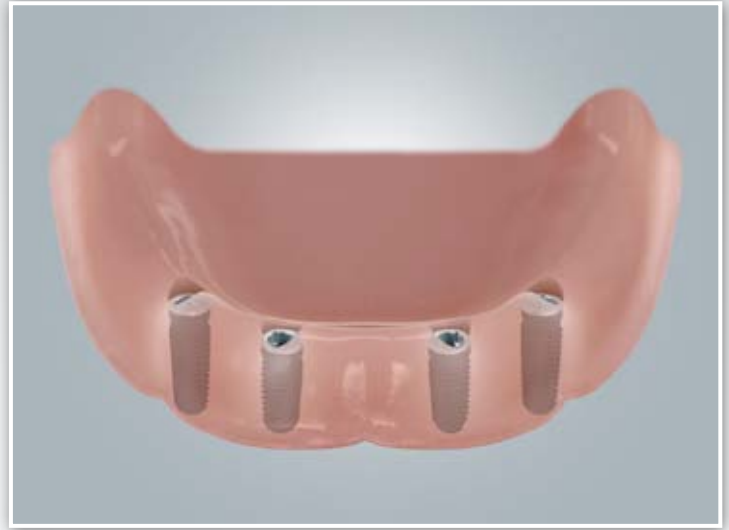
Zahnloser Unterkiefer mit vier Implantaten