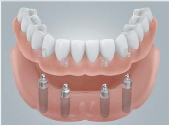
Befestigung mit Kugelankern