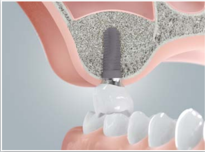
Implantatkrone nach Sinusbodenelevation