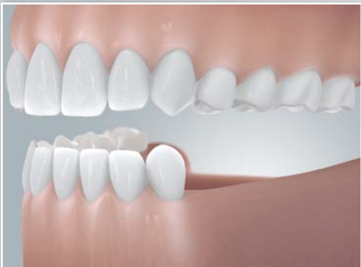
Freiendsituation (verkürzte Zahnreihe)