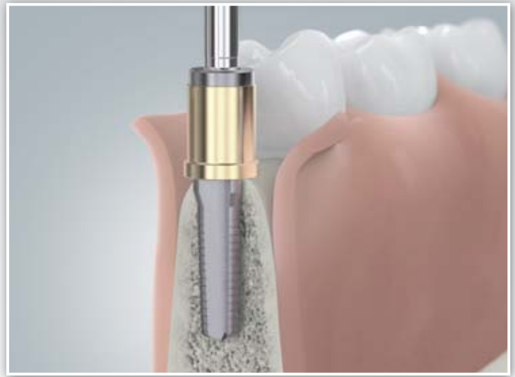
Bohrung mit Spezialbohrer