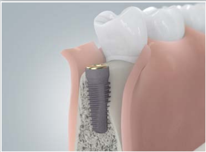
Knochendefizit am Implantat