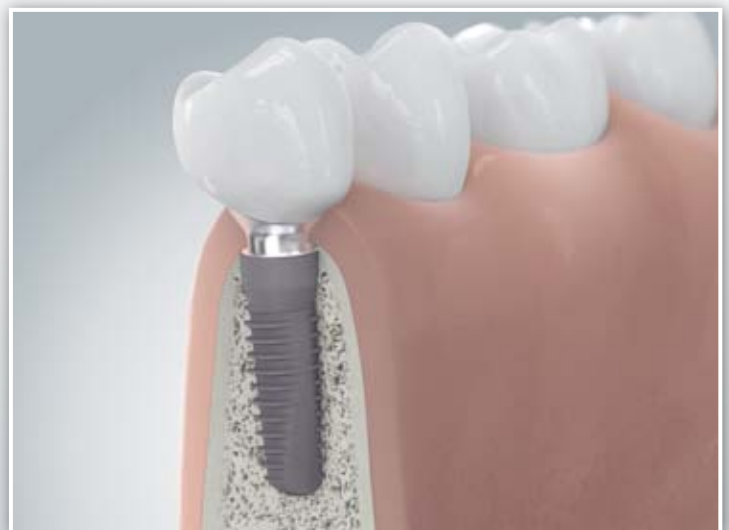
Zahnimplantat, Implantataufbau und Zahnkrone